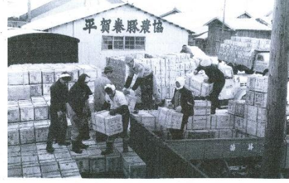
平賀駅でのりんご積み込み (昭和40年頃)