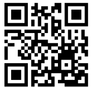
青森りんごの歴史動画

■ 旅行代金に含まれるもの: 貸切バス代、盛美園入館料、弘南鉄道運賃、昼食代、ガイド料、添乗料