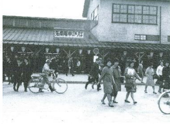
弘前駅電車のりば (昭和32年)