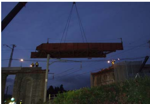
大鰐線 JRこ線橋架替工事