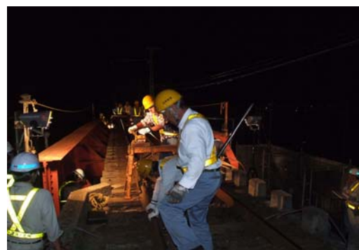
大鰐線 JRこ線橋架替工事